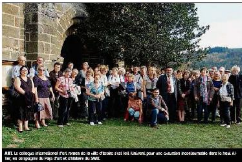
ART. Le colloque international d'art roman de la ville d'Issoire s'est fait l'occasion pour une excursion incontournable dans le haut Allier, en compagnie du Pays d'art et d'histoire du SMAI.

Ce thème, le thème du colloque était « Le corps et ses représentations à l'époque romane ». Sous la conduite d'Annie Be-