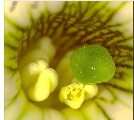
Les organes reproducteurs, pistil et étamines, situés dans le tube de la fleur de Petunia hybrida lors de son ouverture. C'est entre ces organes qu'une molécule volatile est émise et permet la communication induisant le développement normal du pistil.

Le pétunia, qui orne communément nos balcons, est la plante à massif la plus connue et utilisée dans le monde pour sa diversité de couleurs, de morphologies et de senteurs. C'est également un modèle d'étude important utilisé par les scientifiques notamment pour étudier la biosynthèse des parfums, les mécanismes de transport permettant leur émission ainsi que leur rôle écologique de communication chez les plantes. Un chercheur du Laboratoire de biotechnologies végétales appliquées aux plantes aromatiques et médicinales - LBVpam (UJM/CNRS), Benoît Boachon, vient de participer à l'identification du premier récepteur d'une molécule volatile impliquée dans la communication entre organes floraux chez le pétunia. Cette étude, dirigée par le Pr. Natalia Dudareva (Université Purdue, USA) en collaboration avec le Docteur Benoît Boachon) et le Pr. Nitzan Shabek (Université de Californie Davis, USA), est publiée ce vendredi 22 mars 2024 dans la revue Science . Elle décrit pour la première fois le mécanisme de perception et de signalisation d'une molécule volatile permettant la communication entre organes floraux chez le pétunia.