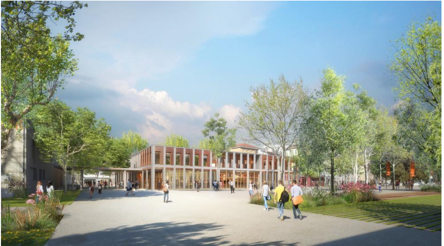
Le parc de campus depuis la bibliothèque universitaire et le nouveau bâtiment