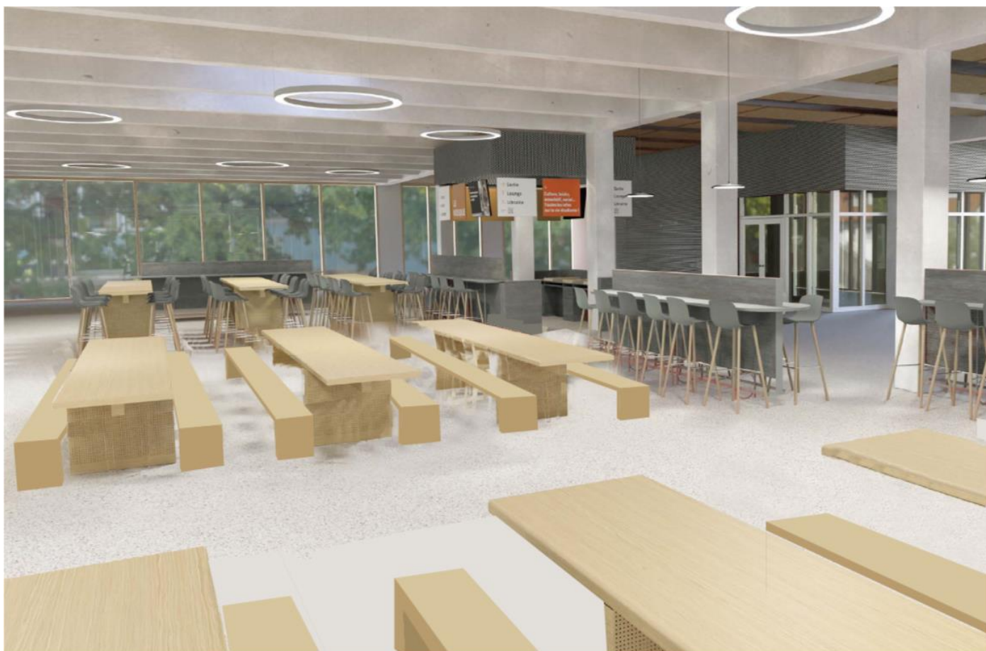
Recherche d'ambiance design pour l'espace mixte de la vie de campus (visuel non contractuel)

La construction d'un nouveau bâtiment, agrémenté de plusieurs terrasses et patios, en lieu et place de l'actuel bâtiment du CROUS va contribuer à la création d'un pôle de vie de campus avec des espaces pour étudier, se restaurer et se divertir.