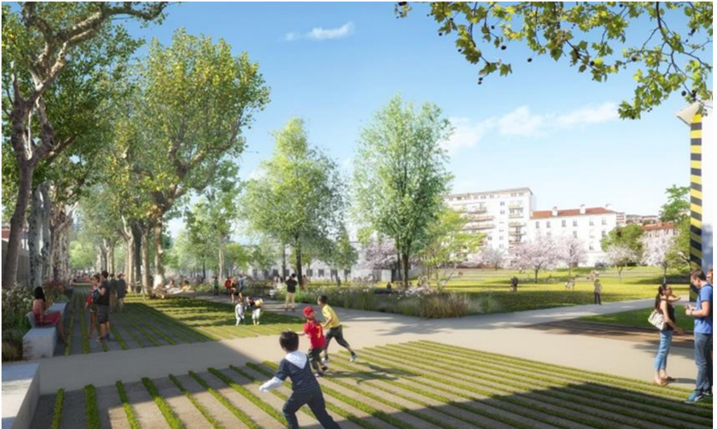
Le parc de campus depuis le parvis du bâtiment J